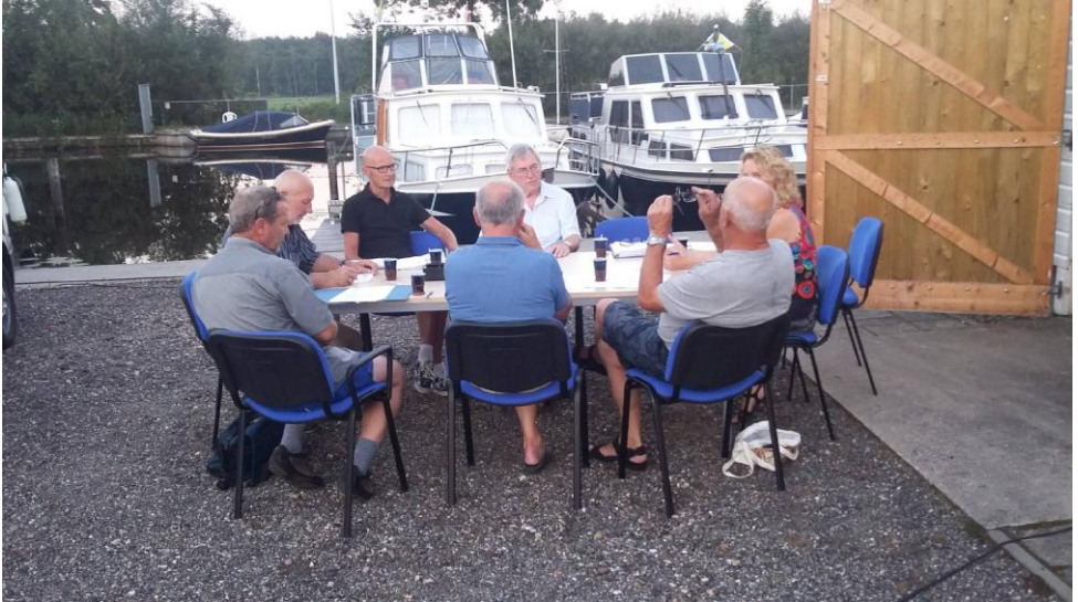
Tijdens de warme nazomer vergadert het bestuur buiten op jachthaven De Bron.