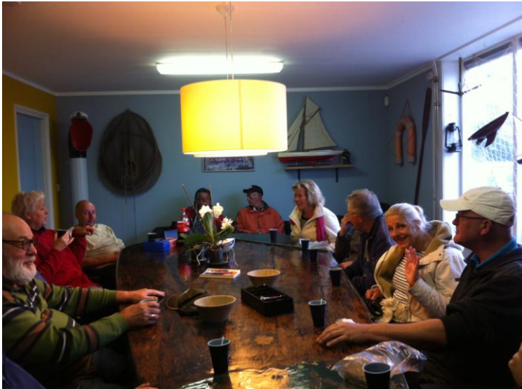
Gezelligheid in de kantine op De Welle