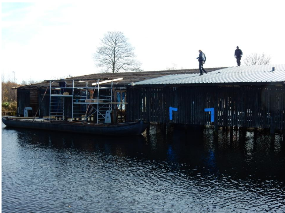
Vervanging dak schiphuis E

verenigingsgebouw, De Bron – vervanging van de walbeschoeiingen, zuidzijde en bij schiphuis C). Toch is gedurende het jaar 2016 gebleken, dat er geld nodig was voor het aanbrengen van achterwanden in de DHZ-loods op jachthaven de Welle en was het dringend noodzakelijk om het dak van schiphuis E op jachthaven De Bron zo spoedig mogelijk te vervangen. Dit laatste was nodig, omdat er sprake was van ernstige lekkage en op meerdere plekken in de spanten en gordingen was houtrot geconstateerd. Het bestuur betreurt, dat de laatste werkzaamheden op een ongelukkig tijdstip (november) moesten worden uitgevoerd en dat er sprake was van vertraging in de uitvoering van de werkzaamheden.