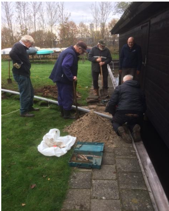
Klusmiddag met vrijwilligers op De Bron