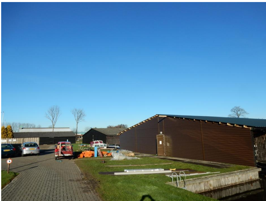
Vervanging dak schiphuis E

Met ingang van 1 januari 2017 is door de vereniging het lidmaatschap van het Watersportverbond opgezegd (conform het besluit van de Ledenvergadering d.d. 15 april 2016). De vereniging oriënteert zich in 2017 om per 1 januari 2018 weer aan te sluiten bij een landelijke belangenorganisatie. Wij zullen u daarover in 2017 informeren.