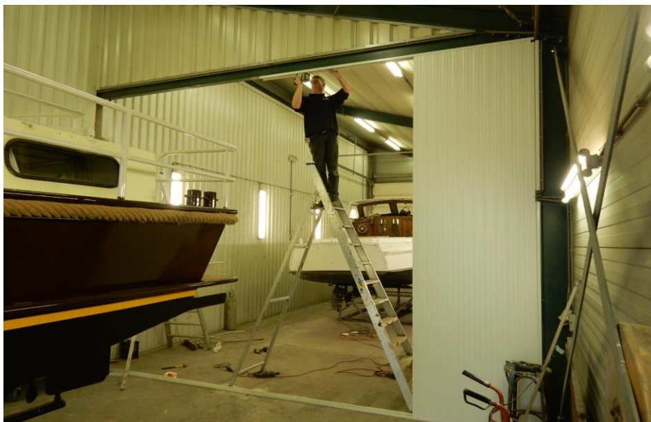
Plaatsen achterwanden DHZ-loodsen De Welle